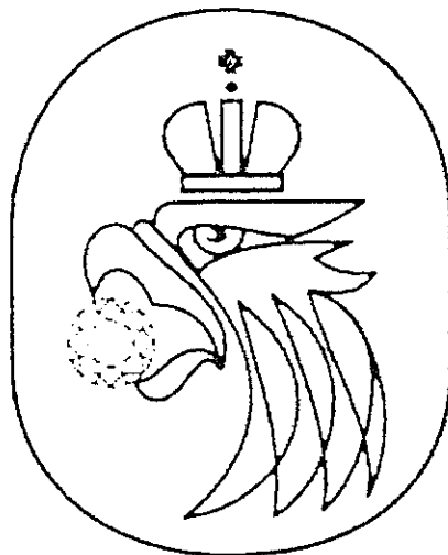
Рисунок эмблемы Гюхрана России

«Приложение № 2 к Уставу федерального казенного учреждения «Государственное учреждение по формированию Государственного фонда драгоценных металлов и драгоценных камней Российской Федерации, хранению, отпуску и использованию драгоценных металлов и драгоценных камней (Гюхран России) при Министерстве финансов Российской Федерации», утвержденному приказом Министерства финансов Российской Федерации от 30 мая 2011 г. № 196